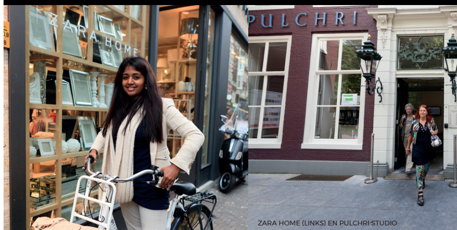
ZARA HOME (LINKS) EN PULCHRI-STUDIO

Uitgave Marketing Haagse Binnenstad Vormgeving Twiet De inhoud van deze route is met de grootst mogelijke zorg samengesteld. Alle informatie is aan wijzigingen onderhevig. Aansprakelijkheid t.a.v. onvolledigheden of wijzigingen kan niet worden aanvaard. © Marketing Haagse Binnenstad, september 2018