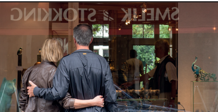
GALERIE SMELIK & STOKKING

grachten is de Denneweg als een openluchtwarenhuis met speciaalzaken waar service hoog in het vaandel staat. Antiek vind je o.a. nog op nummer 3 bij Angevaeren antiquairs en bij Neeltje Twiss op nummer 10. Op 14A stoppen we bij Heden waar je kunst kunt kijken, huren of kopen. Ook zijn er bij Heden altijd interessante tentoonstellingen en worden er tal van cursussen en activiteiten georganiseerd. Sla bij Heden het steegje in naar links en vind hier Galerie Studio Lissabon , een galerie voor multidisciplinaire kunstvormen, maar ook Leeratelier Pieter Bosman waar tassen en andere exclusieve lederwaren in een beperkte oplage vanuit de atelierwinkel worden verkocht.