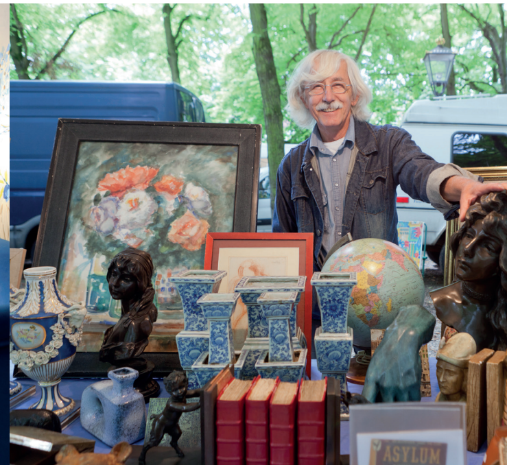
DE HAAGSE ANTIK EN BOEKENMARKT

Voor Escher in het Paleis gaan we naar links, en lopen we via de Vos in Tuinstraat de Denneweg op. Vroeger was dit dé antiekstraat van Den Haag, tegenwoordig is het een 'must' voor liefhebbers van lifestyle en design op internationaal niveau. Met z'n aangrenzende straatjes en